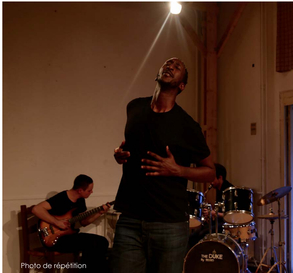
Photo de répétition

Alors, nous, acteurs/citoyens, aurons été des passeurs.