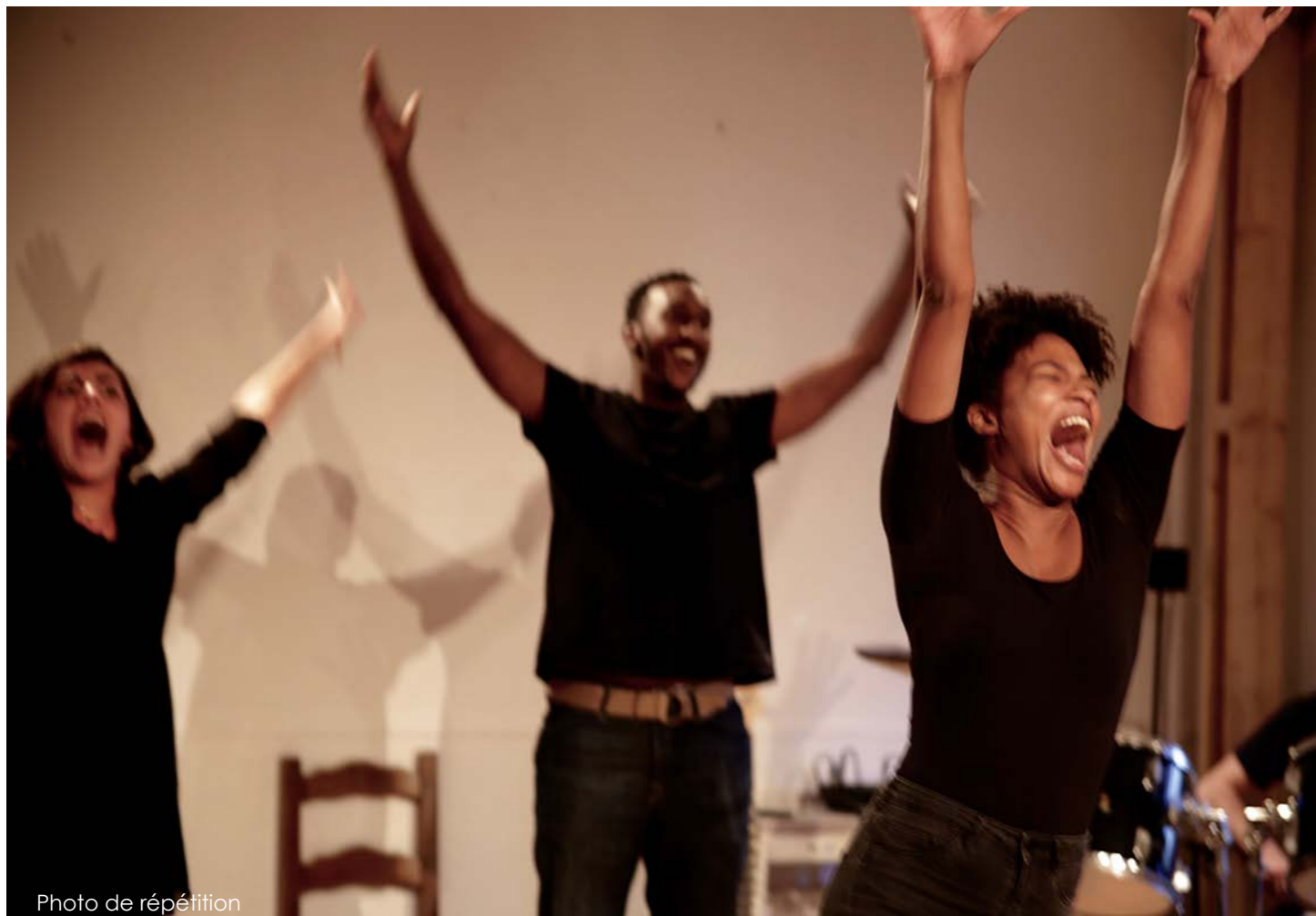
Photo de répétition